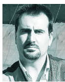
testo e foto di Simone Bertini

FABARM AXIS RS 12 SPORTING Q.R.R. CAL. 12